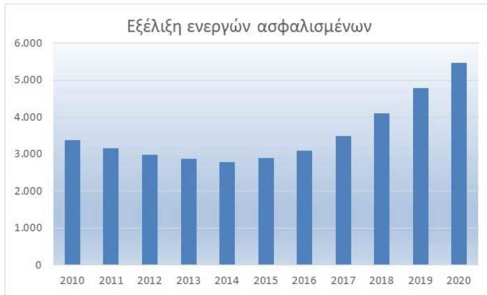
Διάγραμμα 3.2: Εξέλιξη ισοζυγίου Εγγραφών-Διαγραφών ενεργών ασφαλισμένων