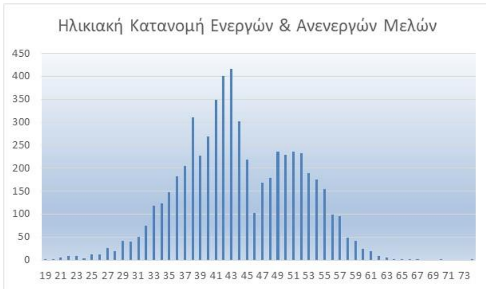
Διάγραμμα 3.4: Ηλικιακή Κατανομή συνολικών ασφαλισμένων μελών 31/12/2020

Πίνακας 3.5: Κατανομή πληθυσμού ανά έτη ασφάλισης στο Ταμείο (επισημαίνεται ότι κατά την εκτίμηση των ετών ασφάλισης έχει ληφθεί υπόψη στρογγυλοποίηση στο εγγύτερο έτος, αναλόγως αν έχει σημειωθεί υπέρβαση του δμήνου ή όχι κατά την ημερομηνία αναφοράς. Ως έτη ασφάλισης θεωρείται η χρονική περίοδος μεταξύ ημερομηνίας εγγραφής στο Ταμείο και ημερομηνίας αναφοράς).