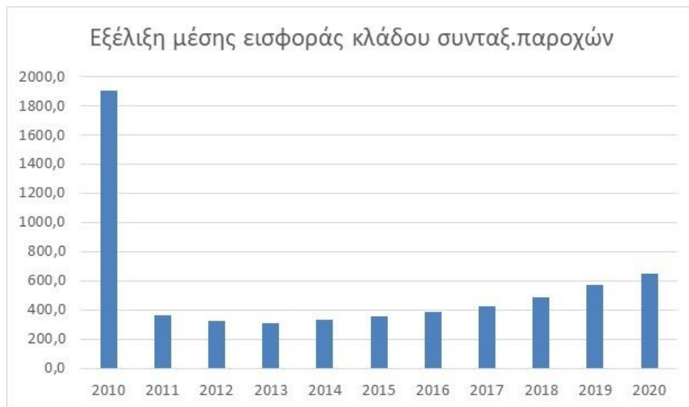
Διάγραμμα 4.1: Εξέλιξη μέσης εισφοράς κλάδου Συνταξιοδοτικών Παροχών :

Από τον ανωτέρω πίνακα προκύπτει αύξηση της μέσης ετήσιας εισφοράς κλάδου Συνταξιοδοτικών Παροχών για τις χρήσεις από το 2014 και εφεξής. Ειδικότερα, το 2019 η μέση εισφορά αυξήθηκε κατά 17% και συνεχίστηκε το 2020 με αύξηση κατά 12%.